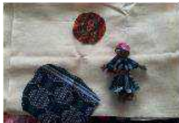
Step 6 Plan your arpillera