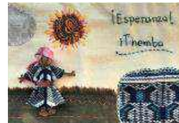
Step 9 Final arpillera, ready to hang