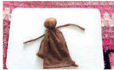
Step 2 Make arpillera doll head