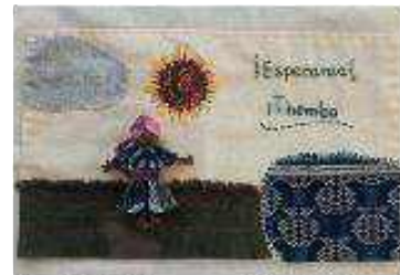
Step 7 Stitch your arpillera together