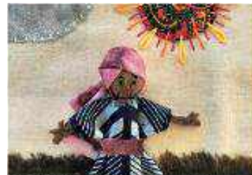
Step 8 Add details to the arpillera with stitching