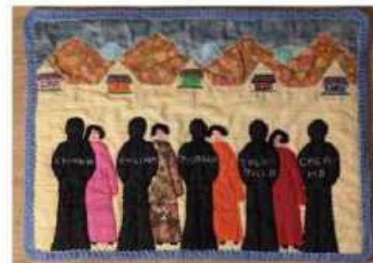
Figure 1. Cinco sitios de desaparición colectiva / Five sites of collective disappearance. Chilean arpillera , Irma Müller (1988).

brutality of the repression' (Agosin, 2008, p56). The juxtaposition between the colourful materials and people, and sometimes cityscapes or countryside scenes, with political messaging and scenes of social injustice, is the hallmark of arpilleras . This is the essence of their power as an art form. Although the creation of dissonance between domesticity and the subject of war is not uncommon in textile work on conflict (Zeitlin