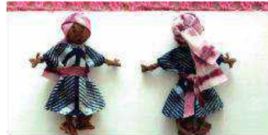
Step 5 Dress arpillera doll (front, back)