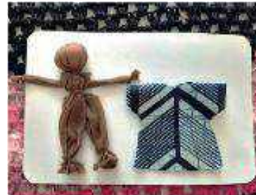
Step 4 Make your arpillera doll's clothes