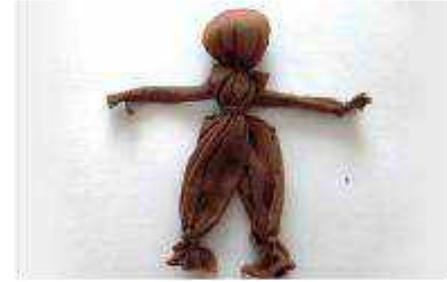
Step 3 Make arpillera doll body